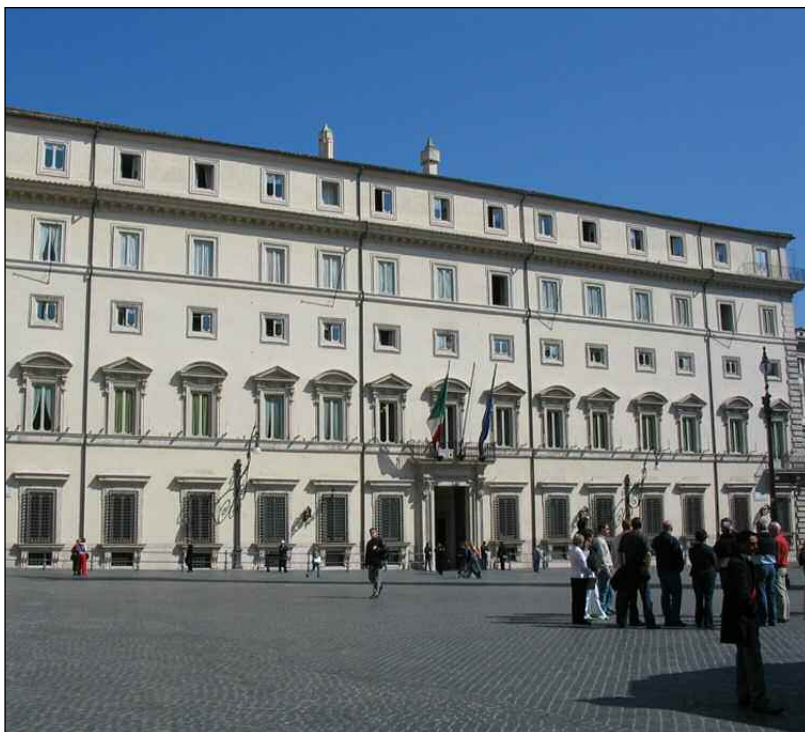
Nella foto in alto l'esterno di palazzo Chigi

La norma soddisfa il centro-destra che la considera un'interpretazione della vecchia norma, per il centro-sinistra è "un regalo"