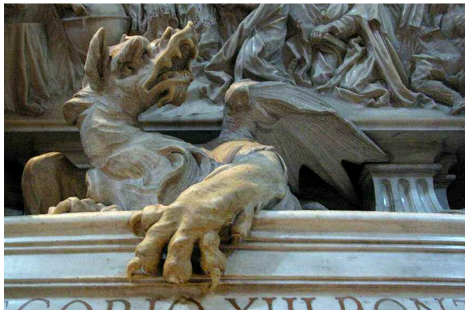
Sopra un'immagine dell'interno di San Pietro

"Non è nuova, è una legge interpretativa"