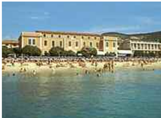
Un albergo Casa Valdese in Liguria su cui i religiosi di questa confessione continueranno a pagare l'Ici

"Sono i cattolici che ci guadagnano molto di più"