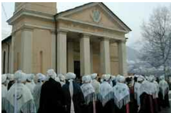
Sopra un'immagine di un corteo Valdese; sopra l'immagine della nuova pagella e a sinistra una statua di Padre Pio

La chiesa avventista rifiuta di destinare i fondi ottenuti (2,4 milioni di euro nel 2004) alle esigenze di culto e al sostentamento del clero: i fondi ricevuti sono devoluti esclusivamente a scopi umanitari, sociali, assistenziali e culturali. Per il 2003 gli avventisti hanno dichiarato il 7,5% di spese in gestione e pubblicità. Le Assemblee di Dio invece destinano i fondi (circa settecentomila euro ricevuti dallo Stato nel 2004, 1,4 milioni con gli accantonamenti degli anni precedenti) esclusivamente a progetti culturali e di solidarietà in Italia e all'estero (non sono finanziate le attività di culto). Nel 2004 lo Stato ha ricevuto circa 100 milioni; sottraendo gli 80 milioni di euro che, a partire dalla finanziaria 2004, vengono trasferiti al bilancio generale, rimangono 20 milioni di euro che sono stati distribuiti in questo modo: il 44,64% per la conservazione beni culturali legati al culto cattolico, il 24,73% per le calamità naturali, il 23,03% per la conservazione beni culturali civili il 4,44% per la fame nel mondo, il 3,16% per l'assistenza ai rifugiati. Ed è l'unico a non farsi pubblicità.