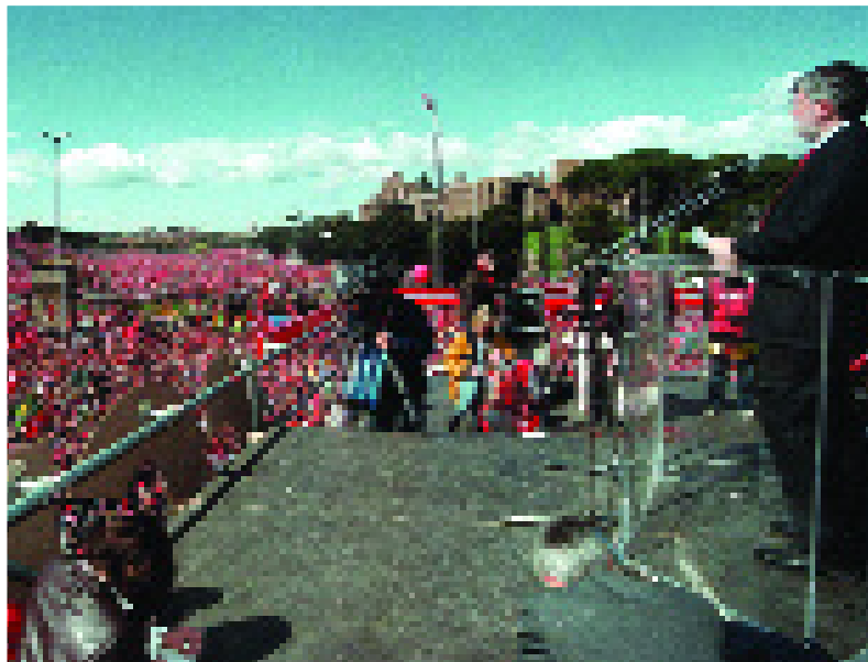
Sergio Cofferati sul palco della manifestazione al Circo Massimo, a Roma, contro la modifica dell'articolo 18. È il 23 marzo 2002