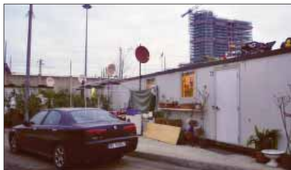
Sopra, un'auto nel campo Triboniano.

A destra, un rom davanti alle macerie dell'abitazione dove viveva, nel campo di via Bonfadini. "Hanno fatto uno sfregio a buttare giù tutto - sostiene - perché alla fine a cosa è servito? Io rimango qui, ospite da mia cognata. Avevo speso 30mila euro per costruirmi la casa. Comunque i miei figli vanno a scuola lo stesso, non faccio come altri che non mandano più i bambini a scuola dopo che gli hanno buttato giù la casa"