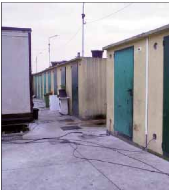
Le bollette dell'elettricità (che viene usata per scaldarsi e cucinare: dopo un incendio il gas è stato vietato) possono superare i mille euro. Molti rom hanno allacciato le case alle prese dei bagni comuni